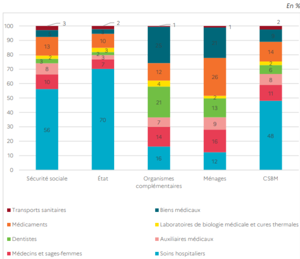
Tableau n°2 : Structure de la dépense des financeurs de la consommation de soins et de biens médicaux (CSBM) en 2021

Lecture > En 2021, 56 % des dépenses de Sécurité sociale sur le champ de la consommation de soins et de biens médicaux (CSBM) concernent des soins hospitaliers.